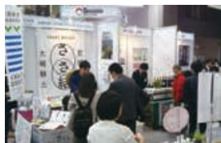
アグリフード EXPO 大阪(令和2年2月)