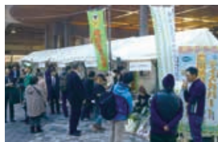
東京の有楽町におけるマルシェ(令和元年12月)

「ディスカバー農山漁村の宝」に選定された地区に対しては、選定証の授与を行います。また、農林水産省ホームページ等で活動を紹介するほか、様々なイベントへの出展支援を通じて、全国的な情報発信を行います。コロナ禍における第7回選定では、選定地区の地域産品や取組を特設ウェブサイト内で紹介し、全国へ幅広く発信しました。