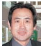
永島敏行 俳優 (有) 青空市場代表取締役