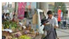
軽トラによる移動販売