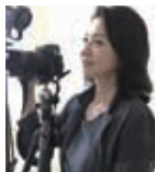
織作峰子 大阪芸術大学教授 写真家