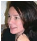
あん・まくだなるど 上智大学大学院教授 慶応義塾大学特任教授