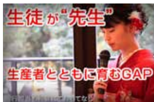
特設 Web サイト内取組発表ページ