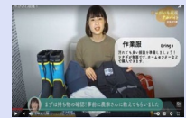
農作業説明動画 アルバイトの検討材料、 事前学習用として活用