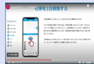
アプリの操作方法 説明動画